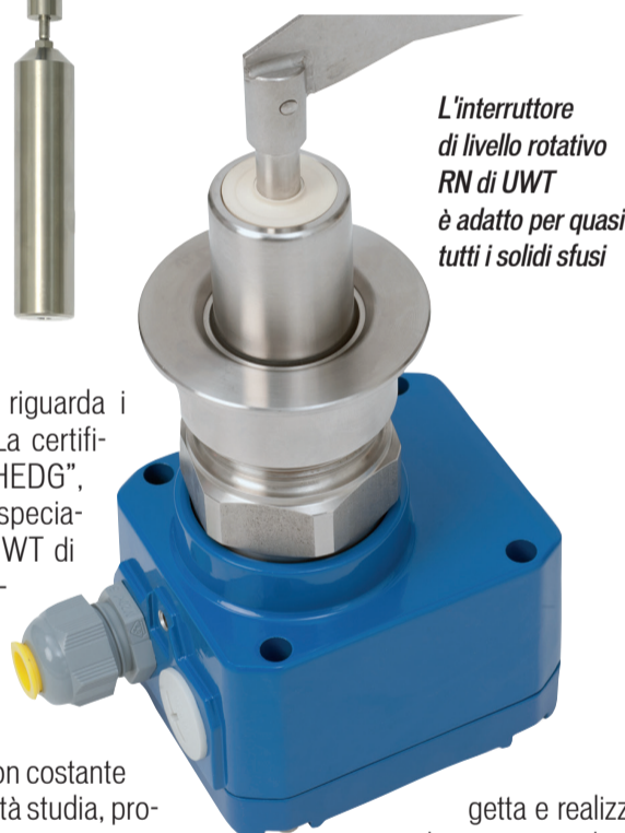
L'interruttore di livello rotativo RN di UWT è adatto per quasi tutti i solidi sfusi

particolare per quanto riguarda i mercati internazionali. La certificazione sanitaria "EHEDG", nonché altre soluzioni specializzate, consentono a UWT di risolvere autonomamente applicazioni difficili.