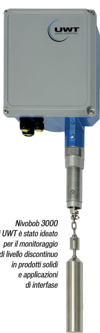
Nivobob 3000 di UWT è stato ideato per il monitoraggio di livello discontinuo in prodotti solidi e applicazioni di interfase

L'azienda tedesca è certificata ISO 9001: 2015 e amplia costantemente il suo portafoglio di certificazioni, in