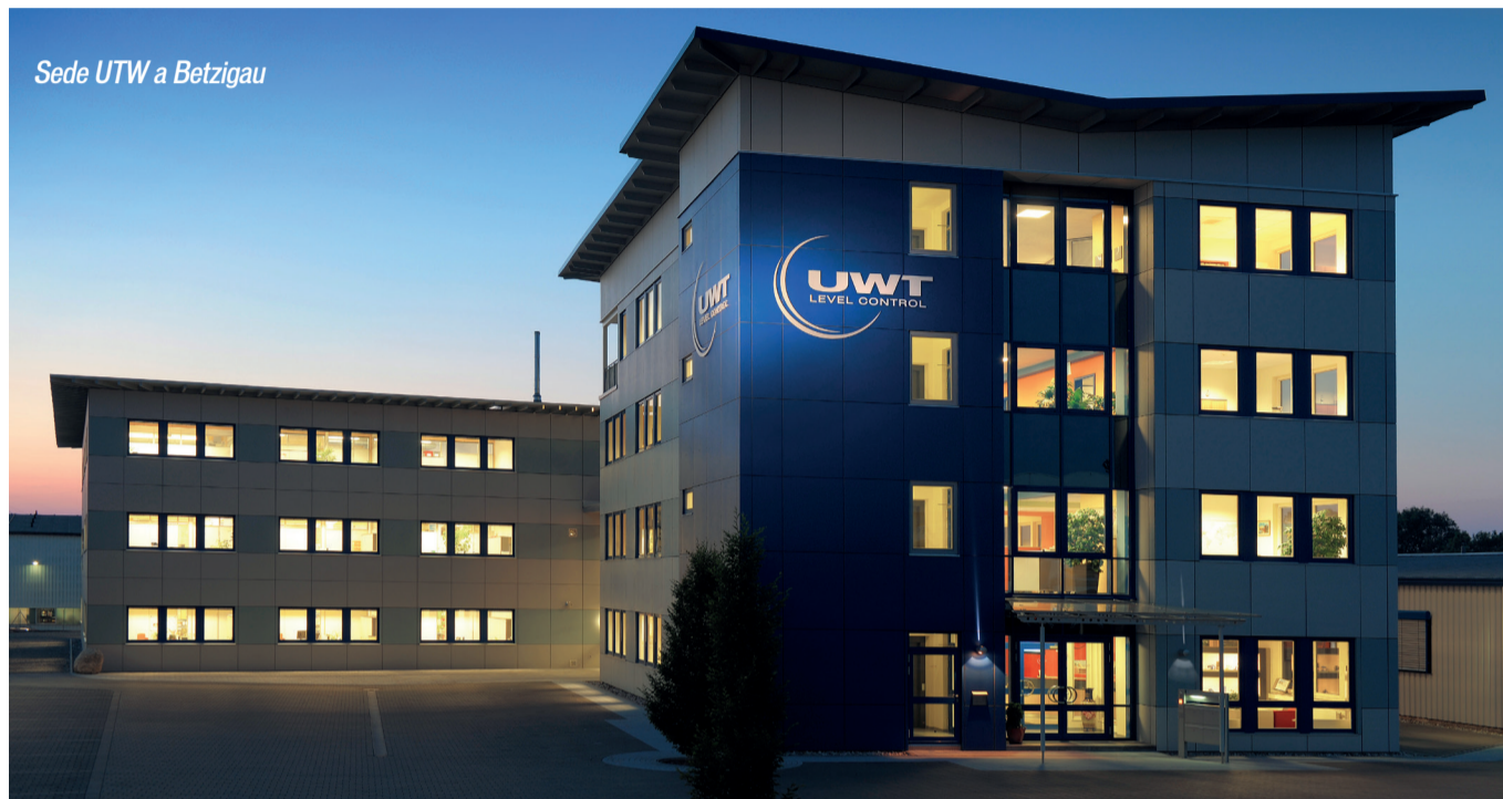
Sede UWT a Betzigau

Si rafforza sempre di più il legame fra le due realtà: l'azienda tedesca in forte crescita è specializzata in misure di livello per prodotti solidi e liquidi