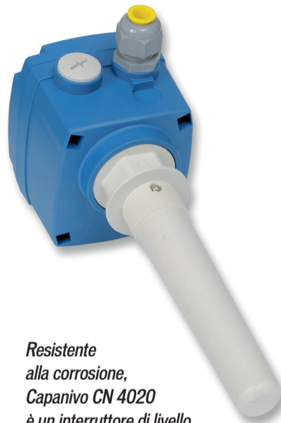
Resistente alla corrosione, Capativo CN 4020 è un interruttore di livello capacitivo di UWT che non richiede manutenzione